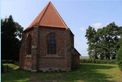
St. Ewaldt in Bodstedt

Angefangen hat alles vor vielen Jahren mit der Idee des St.-Jürgen-Weges von Barth über Kenz nach Starkow (oder umgekehrt). Dieser Weg führt von Norden gegangen vom heutigen niederdeutschen Bibelzentrum in Barth über einen Landweg zunächst nach Kenz zur ehemaligen Wallfahrtskirche St. Marien und der heute im Gesundbrunnen sprudelnden Heiligen Quelle. Weiter in Richtung Süden