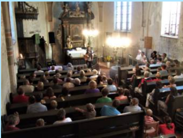
Ein gern gesehener Gast: Gerhard Schöne bei einem Konzert 2012 in unser Bodstedter Kirche.

Der Liedermacher Gerhard Schöne kommt am 6. August zu einem Konzert in unsere Kirche nach Kenz! Wir freuen uns dabei besonders für unsere Kinder und Familien!